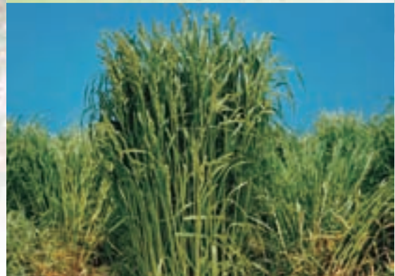
越冬性、春の萌芽、収量性が優れる晩生品種