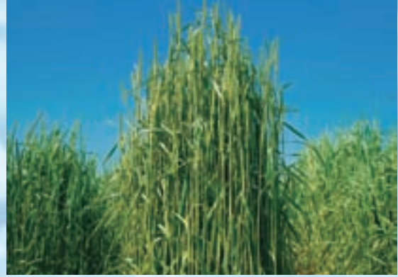
収量性、再生力に優れ、アルファルファ(ケレス)との混播にも最適な早生品種