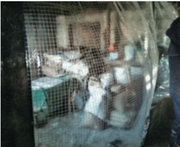
写真2 ビニールカーテン利用による風力の確保