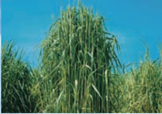
耐倒伏性、再生力に優れる多収品種