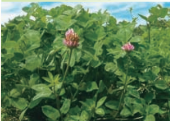
生育が穏やかでチモシー中生品種との混播に最適で 持続性が優れる晩生品種