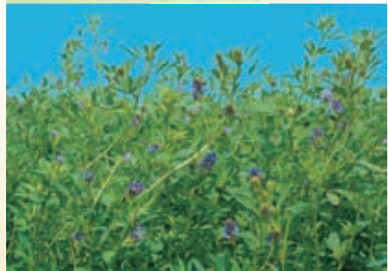
越冬性とソバカス病に強い、 バーティシリウム萎ちよう病抵抗性品種