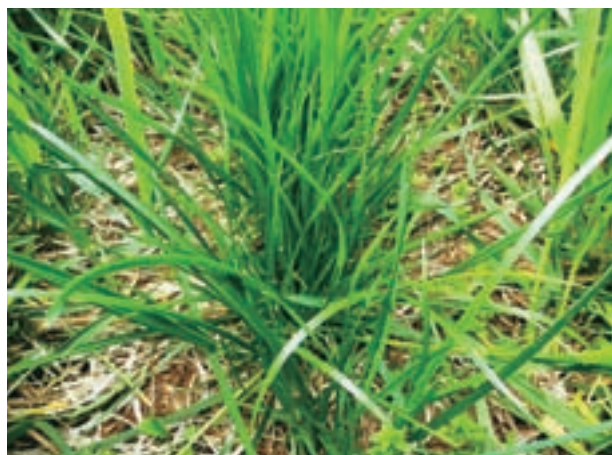
写真1 追播後、定着したペレニアルライグラス

搾乳牛舎については、すでにトンネル換気を導入していましたが、牛舎の構造上入気が不十分な状況であったため、7月～12月のBCSおよび生産乳量低下の傾向については暑熱の影響を受けていることが推察されました。