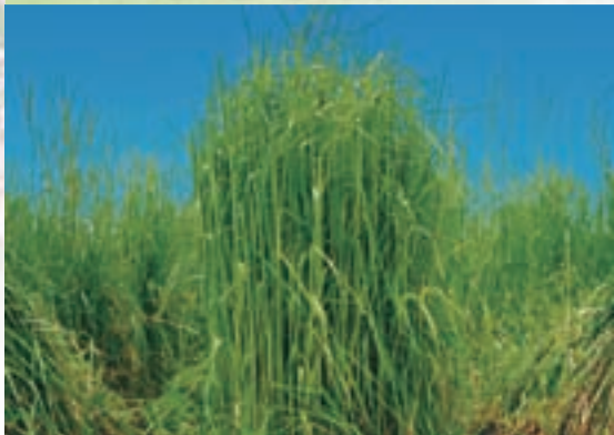
1番草が極多収な採草用晩生品種